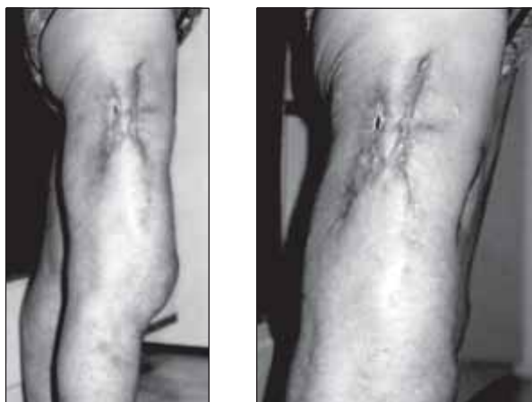
Рис. 3. Раны на 7-й неделе лечения анолитом

ние анолитом. Я использовала его наружно для промывания и примочек. Результат стал проявляться к концу 1-й недели: цвет раны изменился (от темно-синего до ярко-красного), раны стали потихоньку стягиваться. Полностью рана закрылась к концу 2-го месяца лечения. В больницу я больше не ходила.