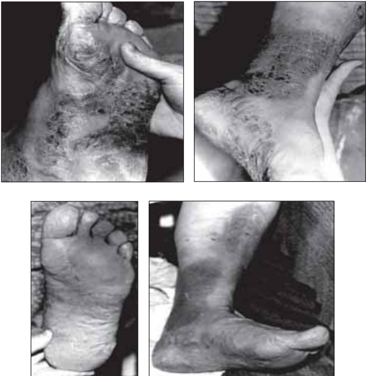
Рис. 4. Результаты применения анолита при хроническом дерматозе, осложненном грибковой инфекцией. Наверху — ноги пациентки до лечения. Внизу — через 2 недели лечения анолитом

Следующие фотографии взяты из моего архива. Эта женщина пришла ко мне домой. Откуда она узнала, что я могу ей помочь, я уже не помню. Помню только, что открываю дверь (дело было зимой), а там стоит эта женщина в тапочках. У нее были такие отекшие и распухшие ноги, что ни сапоги, ни туфли не налезали. Больна она к тому времени была уже больше 6 месяцев, с лета,