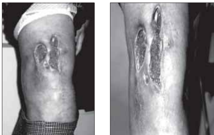
Рис. 2. Раны на 2-й день лечения анолитом